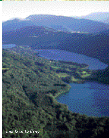
Les lacs Laffrey

Itinéraire facile, idéal pour une balade de découverte en famille à travers l'histoire.