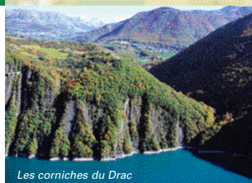
Les corniches du Drac

À Séchillienne, obliquer à droite vers la D114 puis vers la D113 pour rejoindre Laffrey. Après avoir levé sa gourde à la santé de Napoléon, à Laffrey prendre la D115 vers Chollonge, Villard-Saint-Christophe, Saint-Honoré, Nantes-en-Ratier et retour vers la Mure.